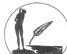
Premio Nazionale HISTONIUM

È possibile trovare notizie riguardanti il Premio sul sito: www.premiohistonium.it